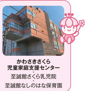
かわさきさくら 児童家庭支援センター 至誠館さくら乳児院 至誠館なしのはな保育園

神奈川県川崎市多摩区菅稲田堤1-10-5 至誠館さくら乳児院内 京王相模原線「京王稲田堤駅」(北口)より徒歩4分 JR南武線「稲田堤駅」より徒歩3分