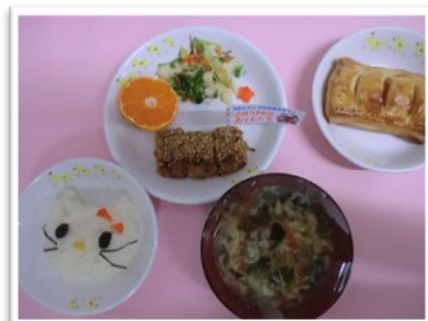
スペシャルメニュー

子ども達が楽しみにしている毎月の誕生会やひなまつりなどの行事の際は、 スペシャルメニュー を提供します。